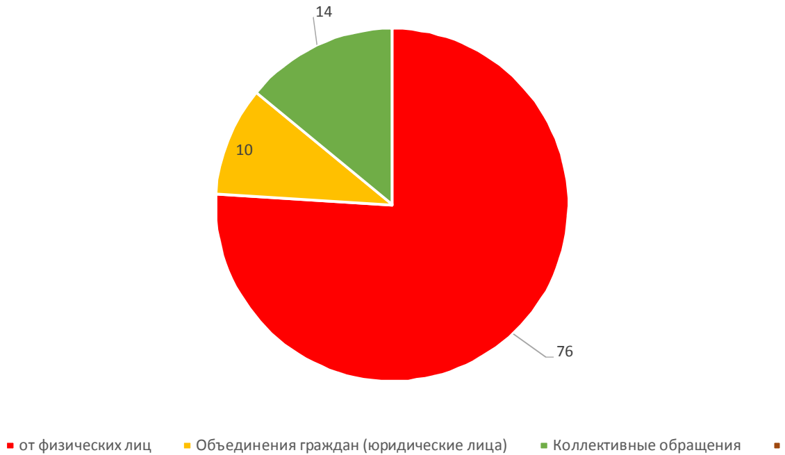
Анализ обращений граждан, поступивших в 1 квартале 2017 года (по результатам рассмотрения)