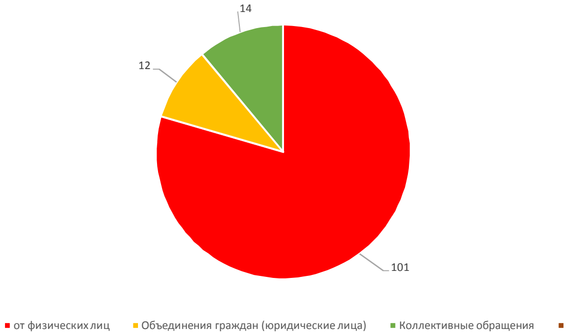
Анализ обращений граждан, поступивших в 1 квартале 2018 года (по результатам рассмотрения)